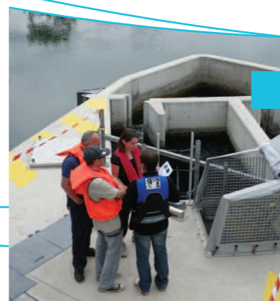
Visite de Croin