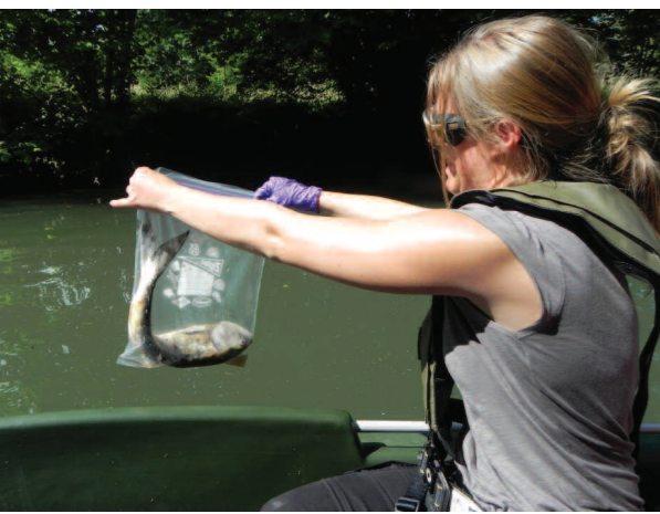
Récupération de cadavres d'alooses

Les résultats montrent, selon la méthode utilisée, de forts écarts. Ainsi, suivant les années, les calculs font état de 54 100 à 172 100 géniteurs d'alooses (grandes et feintes) qui auraient colonisé le bassin de la Charente. La poursuite des suivis de l'activité de reproduction et son optimisation (comptage automatique...) est donc essentielle et permettra d'obtenir des résultats plus précis. Enfin, la différenciation de l'aire de répartition des deux espèces dans les années à venir est indispensable pour affiner cette analyse et confirmer les résultats apportés par l'étude du suivi de la reproduction qui suggèrent que plus de 75 % des géniteurs sur l'aval de la Charente sont des aloses feintes.